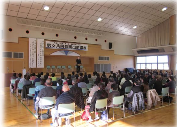
音楽でイキイキ健康増進 美郷町