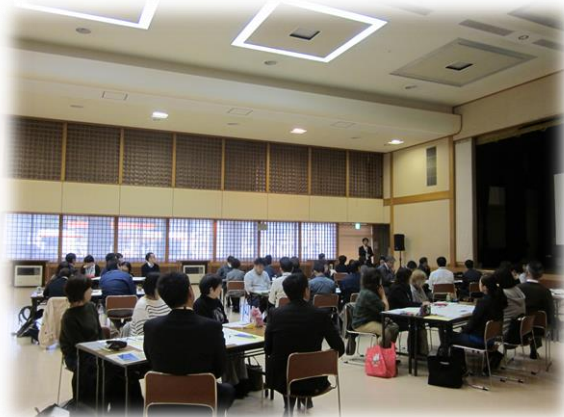
ハラスメント講座 羽後町