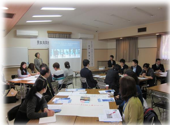
ハラスメント講座 仙北市

11月は、男女共同参画社会づくり基礎講座・男女共同参画地域サポーター養成講座など4つの講座を開催しました。詳細については1月号にてお知らせいたします。