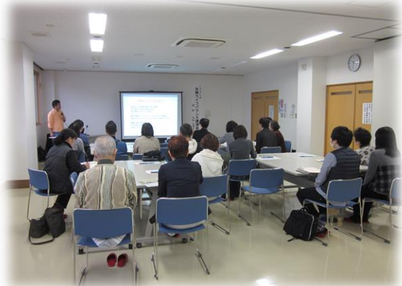
ノブさんの夫婦ライフバランス講座 大仙市