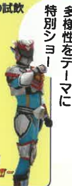
多様性をテーマに 特別ショー