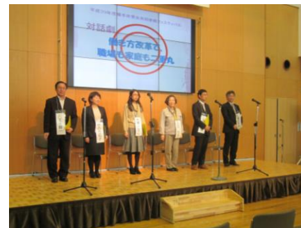
昨年のセンター職員による朗読劇の様子