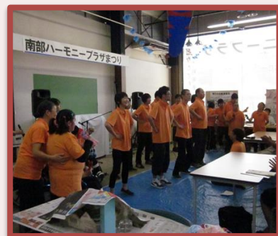
太陽の園 素敵な歌声でした♪