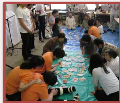
男女共同参画かるた 交流かるた大会