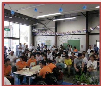
大抽選会 何が当たるかお楽しみ♪